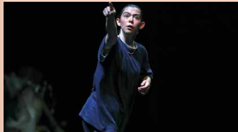
Figure reconnue de la scène internationale, la chorégraphe irlandaise Oona Doherty catalyse, dans sa pièce, les violences et la vulnérabilité des jeunes hommes des quartiers défavorisés de Belfast qu'elle a rencontrés. Ce solo de danse, sidérant et exceptionnel, capte les énergies contraires de ceux qui vivent sans privilèges, tiraillés entre fureur, provocations et espoir. Il donne corps à la colère d'une jeunesse populaire opprimée par la violence politique et sociale, à Belfast et ailleurs.