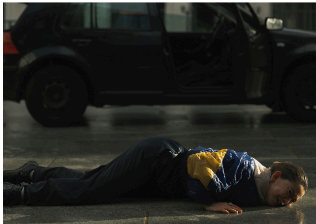
Figure reconnue de la scène internationale, la chorégraphe irlandaise Oona Doherty catalyse, dans sa pièce, les violences et la vulnérabilité des jeunes hommes des quartiers défavorisés de Belfast qu'elle a rencontrés. Ce solo de danse sidérant et exceptionnel, capte les énergies contraires de ceux qui vivent sans privilèges, tiraillés entre fureur, provocations et espoir. Il donne corps à la colère d'une jeunesse populaire opprimée par la violence politique et sociale, à Belfast et ailleurs.

« Hope Hunt se frotte au bitume pour mieux rebondir, entre gravité et espérance. »